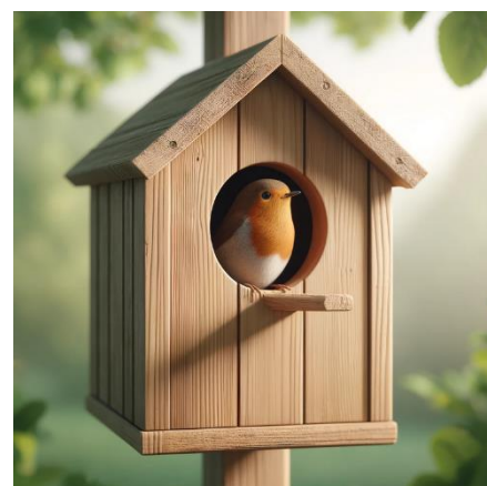
Figuur is gegenereerd met AI van ChatGPT

Daarnaast werken we aan een plan om het aantal nestkasten uit te breiden, ook voor andere vogelsoorten zoals roodborstjes. De gemeente wil deze uitbreiding financieren, en Mikkelfhorst heeft aangeboden de kasten te maken. Het doel is om ongeveer 50 nieuwe kasten te plaatsen. Wilt u helpen of een nestkastje in uw eigen tuin (gratis voor leden)? Mail ons!