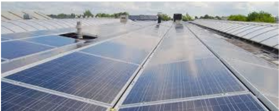
Zonnedak met verschillende manieren van leggen van zonnepanelen

Al met al valt het nog niet mee om een geschikt dak te vinden dat aan de voorwaarden voldoet om te kunnen beleggen met zonnepanelen en te kunnen exploiteren in de vorm van een postcoderoosproject en waar we daadwerkelijk als coöperatie mee aan de slag kunnen. Vandaar onze oproep aan u voor andere suggesties voor een potentieel geschikt zonnedak. Ergens in of rond Haren, in ons eigen postcodegebied of in een postcodegebied dat grenst aan ons 9752-gebied. (Graag gemaild naar energiekmaarwold@xs4all.nl )